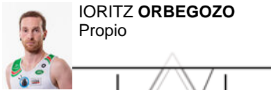
IORITZ ORBEGOZO Propio