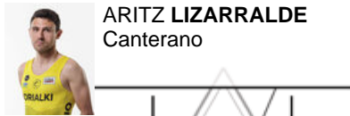
ARITZ LIZARRALDE Canterano