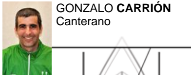
GONZALO CARRIÓN Canterano