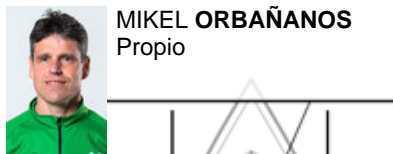
MIKEL ORBAÑANOS Propio