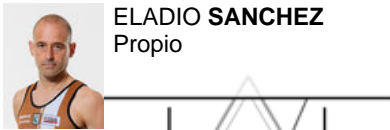
ELADIO SANCHEZ Propio