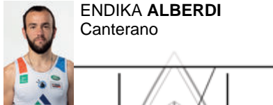
ENDIKA ALBERDI Canterano