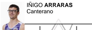
IÑIGO ARRARAS Canterano