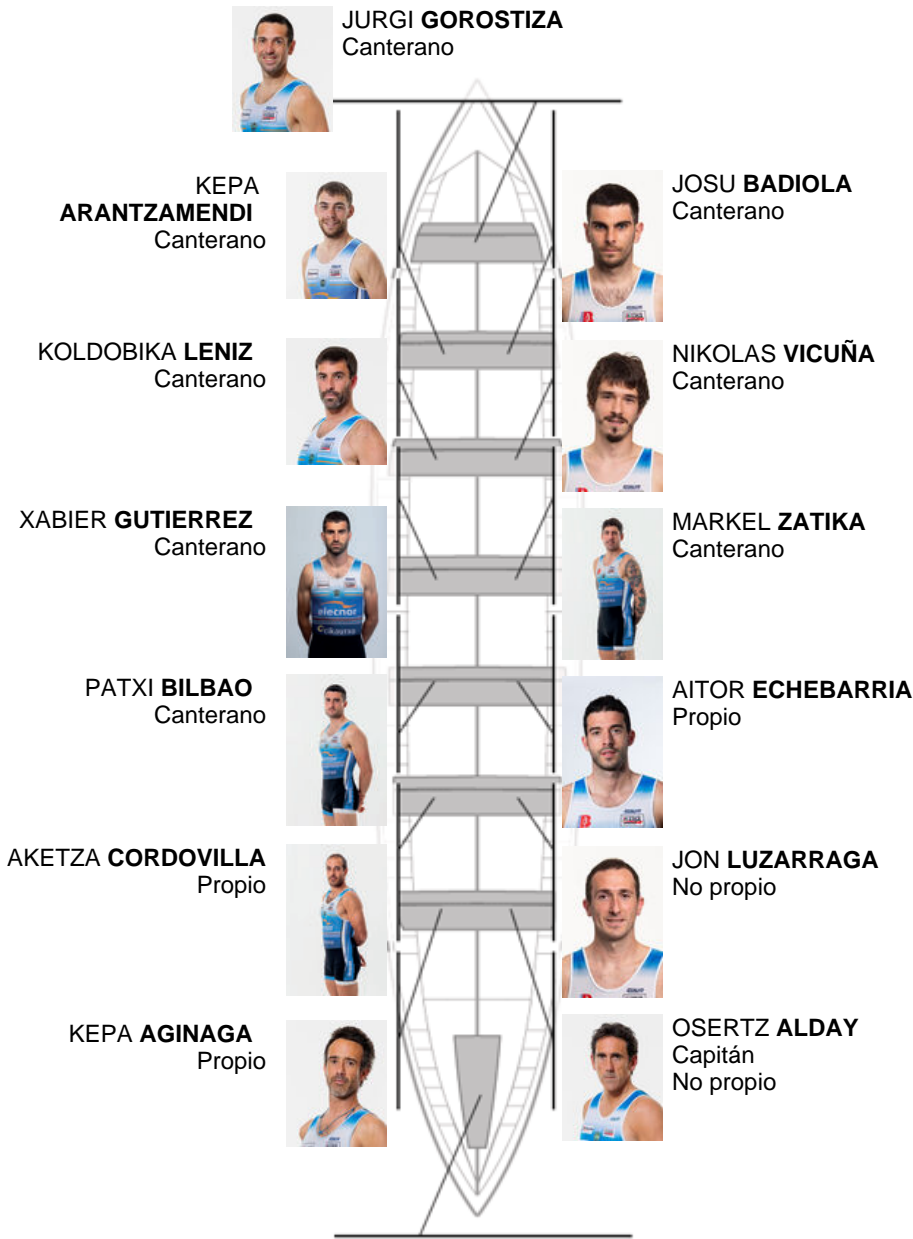
IÑAKI GOIKOETXEA Canterano